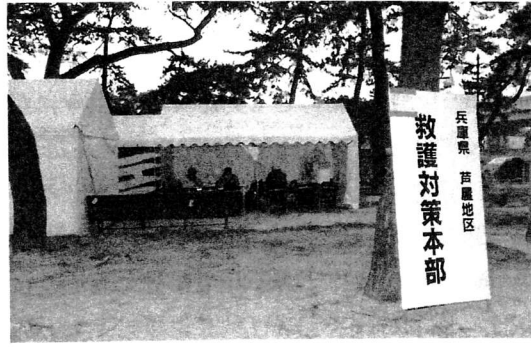
阪神・淡路大震災時に設けられた芦屋地区の救護対策本部

大都市であっても、人口100万人程度ごとには広大な緑地などで互いに遮断し、延焼などを防止できるようにすること。またとくに災害時の危険を2次発生しやすい施設等がある時は、十分に遮断された条件におくこと。