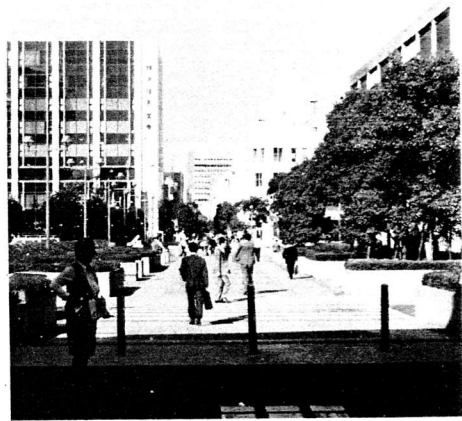
横浜・港町くすのぎ広場

そうしたなかで、人間にとっての都市の意味は大きく変化してきています。昔は大半の人が田舎で生まれ育ち、近くの都市の学校を卒業してから大都市で働き、定年になったら田舎に戻って生活するというパターンがありました。現実はともかく、精神的にはそうした気持で都市を見ていたのです。そういう時代には、人々の意識のなかで都市は遠くにあつて、ちょっと働くための稼ぎ場所、或は時時遊びに行つて見て帰るといふ見物の場所でした。こういう人々にとって都市は仮の宿でした。しかし、いまではほとんどの人が都市で生まれ育ち、住むところは都市しかないわけですから。近年話題となっているUターン現象も、よくみると農村に戻るということはほとんどなく、地方の中核都市あるいは県庁所在