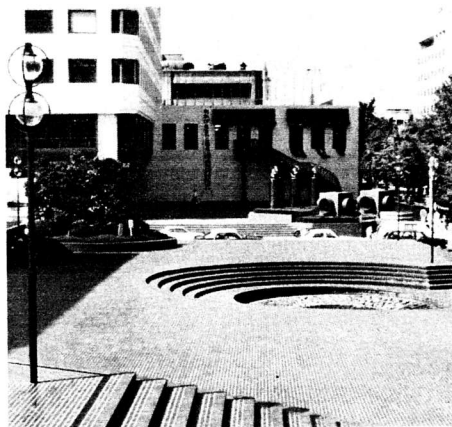
横浜・県民ホールとプラザ

しかし、これまでの明治100年の都市化や都市づくりは、いわば仮設的な都市づくりで