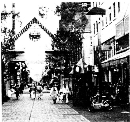
横浜・伊勢佐木モール

ここで、都市をどのように捉えているかと申しますと、私は日本列島全体が都市化しているという認識をもっています。東京、大阪、名古屋と3つの大都市圏があり、合わせて約4,700万人の人口が集中しています。この場合、例えば東京都というような行政単位で抜き出して統計をとっても意味がありません。横浜など以前は独立していた都市もいつの間にか東京に巻き込まれ、大東京圏は神奈川、千葉、埼玉を包含した2,700万人の巨大な連帯都市を形成しています。これにとどまらず、日本列島全体でいま郡部と呼ばれる部分が人口にして20%強位ありますが、そこでさえ一種の都市生活になってきています。農村の乗用車保有率は都市を上回ってさえいますし、農村のテレビ、電話などの普及で大都市と同じように情報を得ることができず。たとえ北海道の端にある島で暮している人でさえ、実は都市生活をしているといえるのです。従って36万平方キロメートルの日本列島全体が、いまやすべて都市的になっているという状態にあります。われわれは都市から逃げるわけにはいきませんし、超巨大都市の中で生れてから死ぬまでそこに住まなければならない人々も多くなっています。