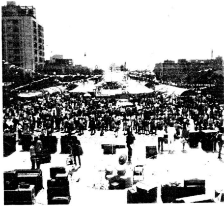
横浜・みなと祭りの大通り公園

昭和25年東京大学第一工学部建築学科卒、運輸事務官、日本生命不動産部、(株)環境開発センター計画部長を経て昭和43年以来横浜市で企画調整部長、同局長を歴任、現在技監。