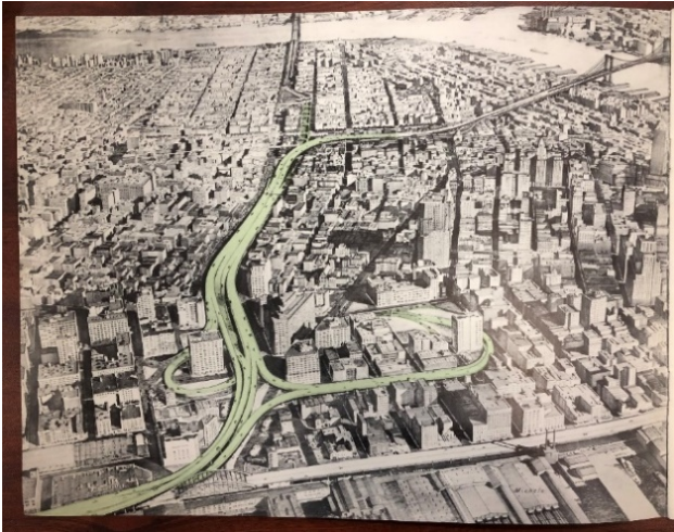
A plan of Lower Manhattan Expressway proposed by Moses and TBTA: Triborough Bridge and Tunnel Authority, Lower Manhattan Elevated Expressway, 15 November 1965, NYC Records & Information Services