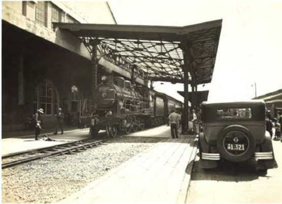
図2. 4号上屋に横付けされた臨港旅客列車 注：横浜みなと博物館、ずっと港のまんなかに 新港埠頭展、p.16、2018.2 にも同アングルの写真があるが不鮮明なため当該写真とした。恐らく元の所蔵は横浜市史資料室と考えられる。