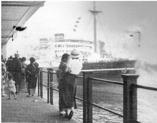
図3. 4号上屋からの見送り風景 1935年当時

関東大震災後に、横浜港には新たな客船ターミナルとして4号上屋が完成する。当時の日本にとって重要航路であった北米航路向けの客船ターミナルだった。二階建てで貴賓室やニューグランドホテルが運営するレストランも備え、送迎デッキは華やかな見送りの場となった。詳細は横浜みなと博物館『新港埠頭展パンフ』によるが、上屋機能も持った巨大な4号上屋は残念ながら煉瓦造りでなく、鉄骨コンクリート造だった。出航時には東京からの臨時旅客列車、当然機関車だが、も横付けされた。戦後も占領軍に接收され、米国との連絡に盛んに使われた。