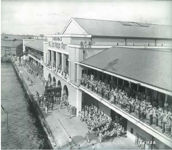
図4. 米軍接收時の出迎え風景

この4号上屋も赤煉瓦倉庫と同じぐらいに貴重な歴史的建物なのだが、保存活用の対象とならず、1979年に取り壊された。取り壊し前に市港湾局から村松貞次郎（東京大学生産技術研究所教授、建築史）に記録保存に依頼があり、1979年3月付で報告書が提出されている。建築史家の堀勇良 1 によると「(当時の記憶は) 茫漠としておりますが、昭和52・53年の赤煉瓦倉庫実測調査の際に、4号上屋も目視調査をし、簡単な所見を私が書きました。当時は、昭和期の建造物が重文指定される見込みはなかったもので、保存を求めるような評価はできなかつたと記憶しています。取り壊しの際に、何か残す物はないかと、いうことで、中央部吹き抜けの手摺や、壁画?などを指摘した気がします。手摺は、一部が、山下町本町通の横浜エスカルの前庭に存置されています」と筆者へのメールにある。